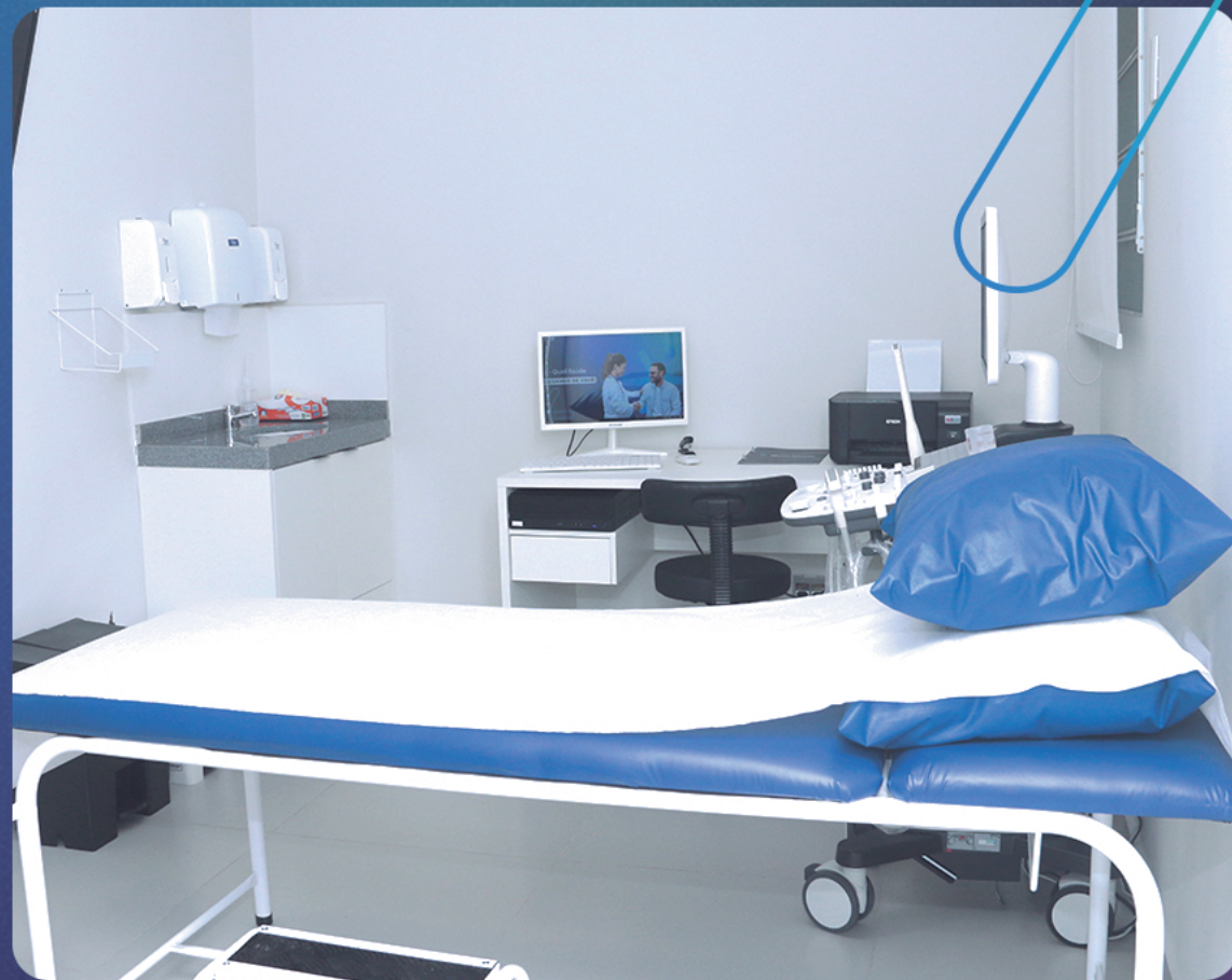
Sala de ultrassonografia