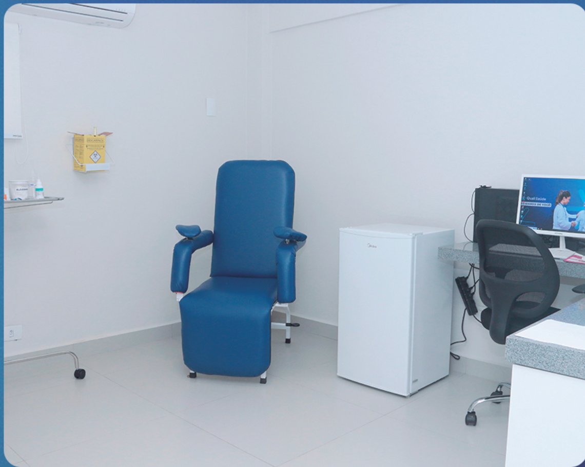
Sala de exames laboratoriais