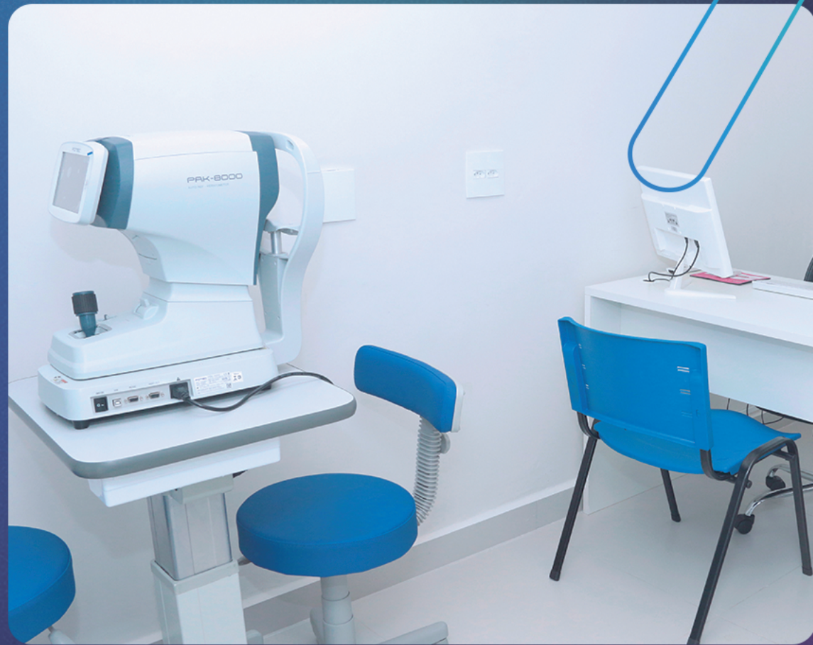
Sala de exames oftalmológicos